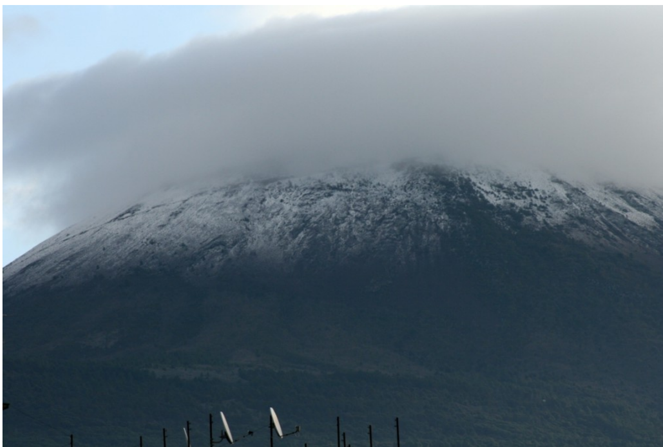
Vezuviul în nori

Traseul virtual are 70 de instalații multimediale, coordonate cu ajutorul unui software original. Pentru amenajarea sălilor, au fost necesari trei ani și s-au cheltuit peste 10 milioane de euro. Vizitatorul evadează în trecut doar cu ajutorul simțurilor: olfactiv, tactil, auditiv și, bineînțeles, cel al văzului. Aici bijuteriile din aur sunt holograme și se aude ploaia care cade pe acoperișul caselor. În termele romane, se simte parfumul uleiului cu care se desfătau romanii și se pot șterge cu dosul palmei oglinzile aburite.