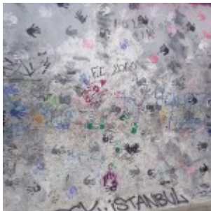
Muro di Berlino – East Side Gallery