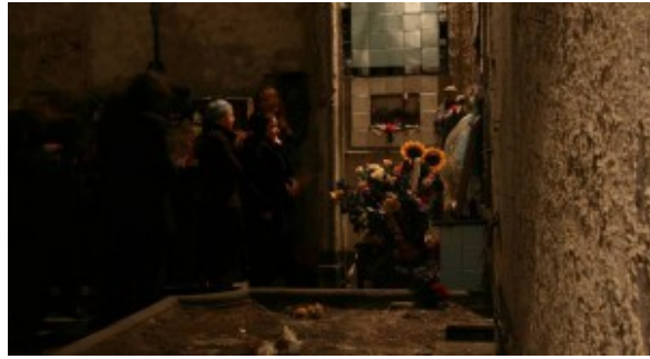
La altarul Luciei

Mie, profanei, mi se pare destul de macabru. Pentru napoletani are însă un sens. Totul pleacă de la un vechi ritual din secolul al XVI-lea, când credincioșii catolici "adoptau" craniile defuncților, despre care nu știau nimic și pentru ale caror spirite se rugau. În anul 1969, Biserica Catolică a interzis cultul adoptării craniilor, întrucât era considerat superstițios. Cu toate acestea, sunt încă mulți cei care nu se supun și continuă să aducă ofrande și să își pună speranțe într-un cap de mort.