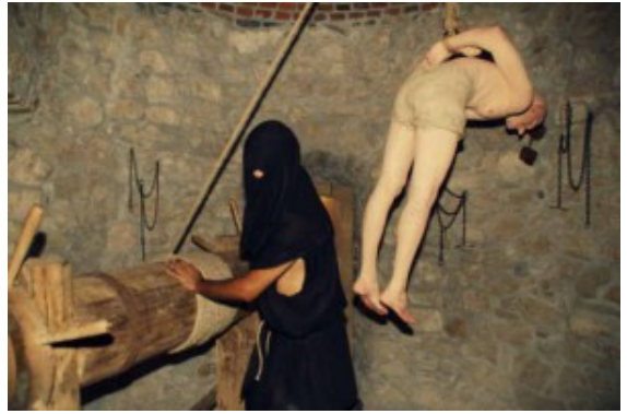
Stanza delle torture